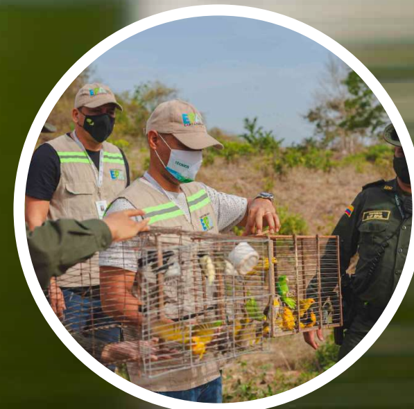
Liberación de Aves

En el 2022, el EPA Cartagena lanzó estrategia para avistamiento de aves migratorias. Se pretende propiciar espacios de sensibilización para la protección de las aves migratorias.