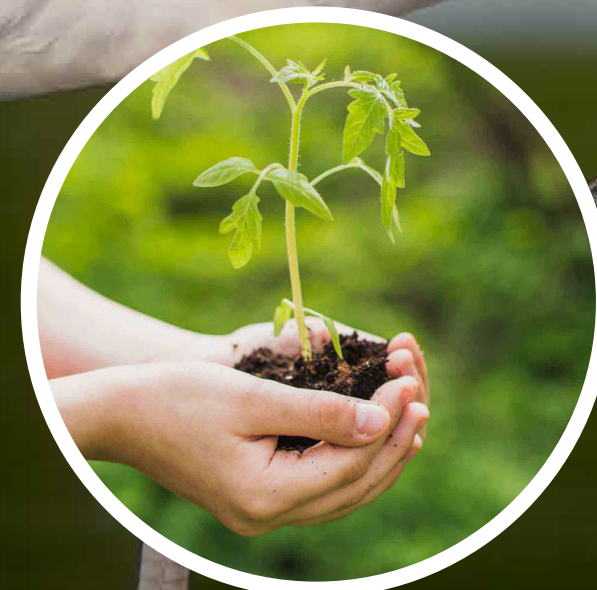
Siembras de Árboles

El EPA Cartagena tiene a cargo la Secretaría Técnica del Comité Técnico Interinstitucional de Educación Ambiental, órgano consultor a través del cual se busca desarrollar estrategias para salvaguardar el patrimonio natural de acuerdo a la Política Nacional de Educación Ambiental.