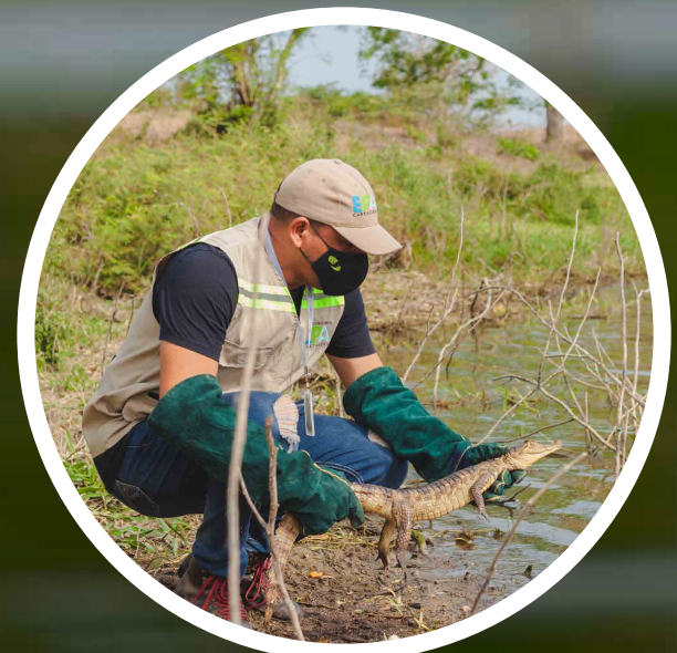
Liberación de Fauna Silvestre

El Centro de Atención y Valoración de fauna silvestre CAV es el sitio donde se reciben especies de fauna silvestre (que después son liberados), flora y/o flora acuática