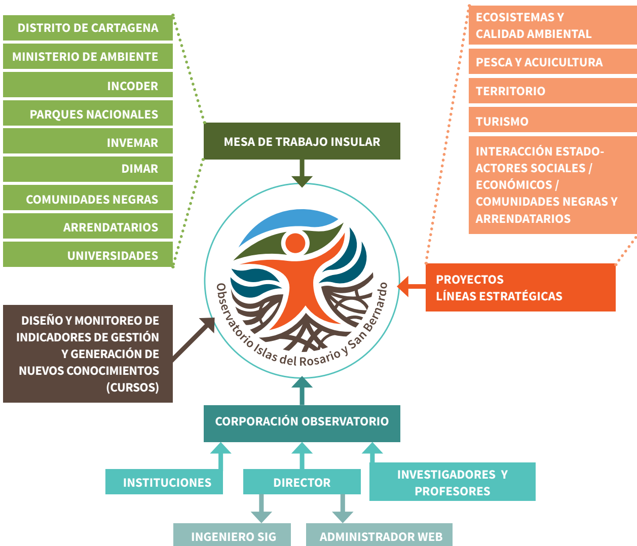
Figura 3. Marco conceptual del Observatorio para el desarrollo sostenible de los archipiélagos de Nuestra Señora del Rosario y de San Bernardo.

El Observatorio se diseña y pone en marcha en el año 2013, como un instrumento para la implementación del “Plan de acción integral como estrategia de administración de los baldíos de los archipiélagos de Nuestra Señora del Rosario y de San Bernardo”. Posteriormente, teniendo en cuenta que es necesario alcanzar su sostenibilidad, se ha considerado la posibilidad de que este se convierta en un ente sin ánimo de lucro con capacidad de gestionar recursos para el desarrollo de proyectos (Figura 3). Partiendo de esta conceptualización y con base en los resultados de los espacios de interacción entre actores, en el 2015 se realizó un taller de planificación para definir la finalidad, el objetivo general y los objetivos específicos del Observatorio, en el cual se empleó la metodología de marco lógico.